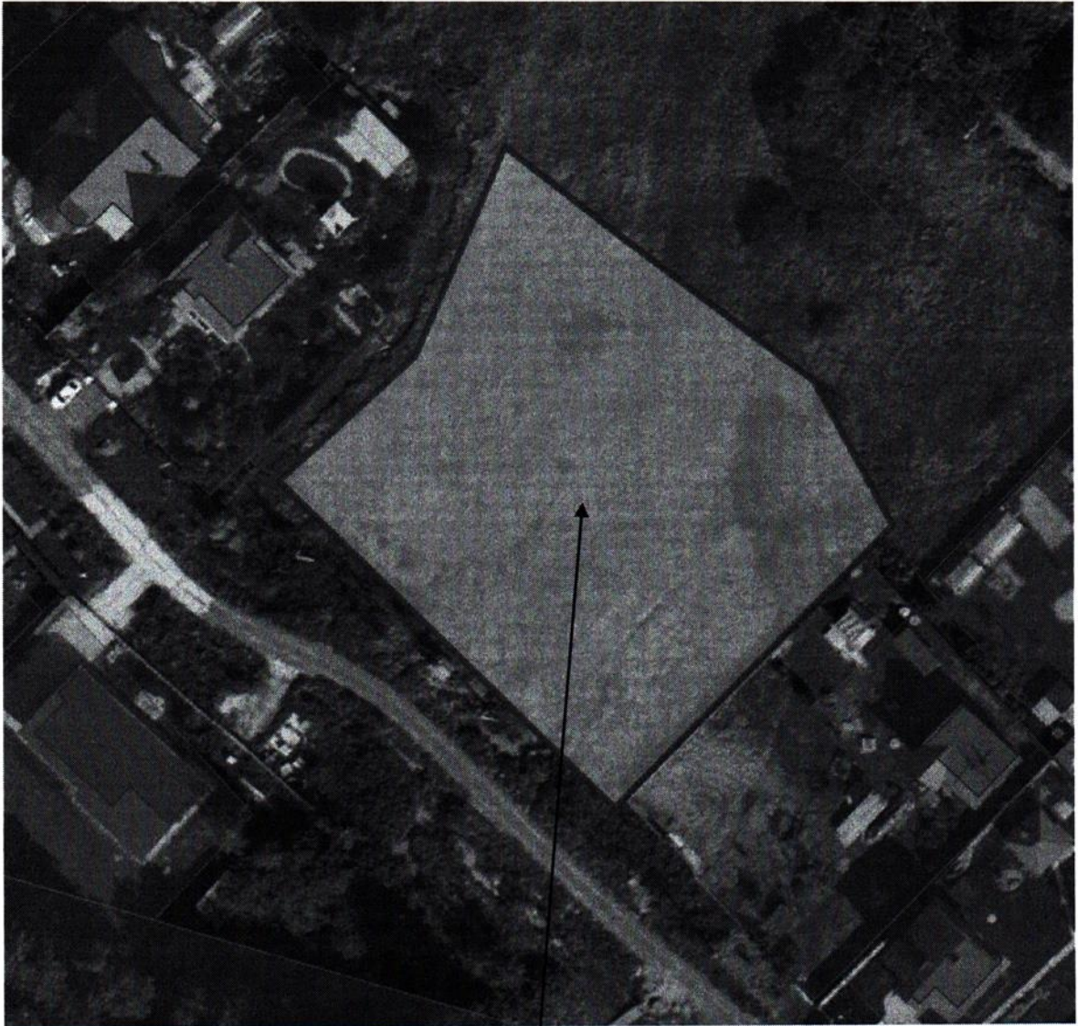
Обследуемый участок с КН 50:26:0100206:1264